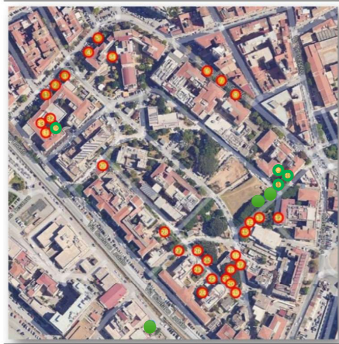
Planimetria generale dell'A.O.U.P. con identificazione alberature esaminate ed identificate

Riferimenti: VTA del 24.10.2024 e consulenza agronomica maggio 2026